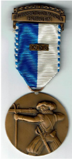
Alte Abzeichen, zugestellt von einem Sammler aus Zürich